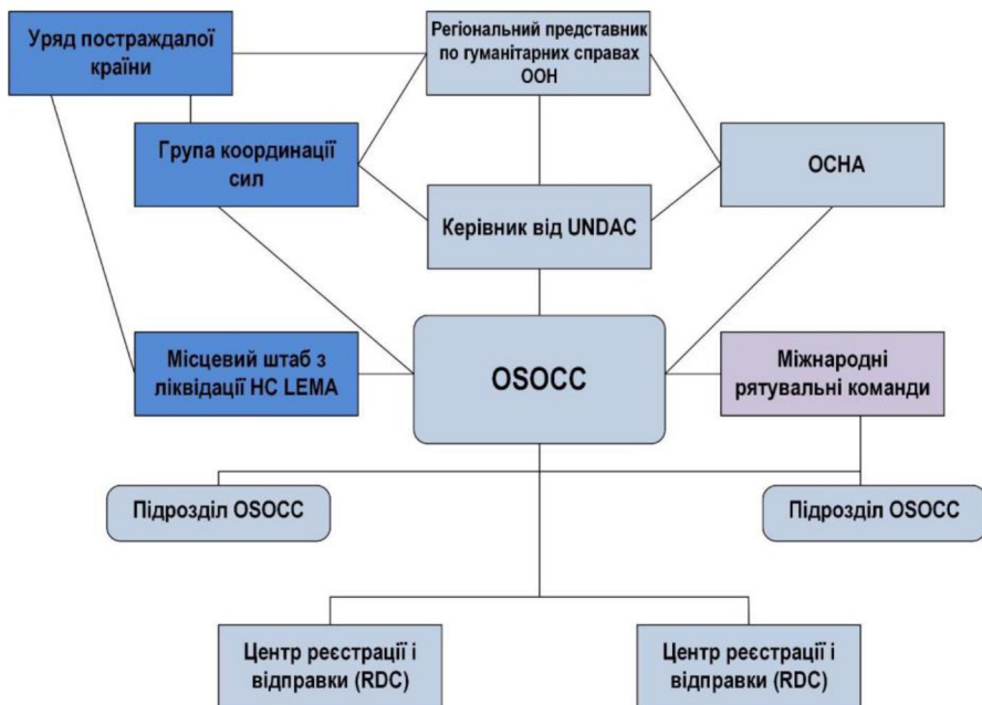
Рисунок 3 – Організація взаємодії OSOCC

для планування організації OSOCC. Потрібно чітко визначити ролі, завдання та очікувані результати членів організації, а також їх взаємодію.