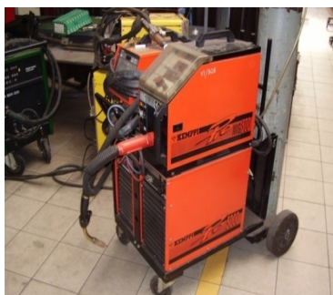
Рисунок 1 – Установа Pro Evolution Kemppi

Для нанесення регенераційного покриття було використано метод дугового наплавлення в газовій атмосфері аргону GMA (MAG), яке проводили на установці Pro Evolution Kemppi (рис. 1).