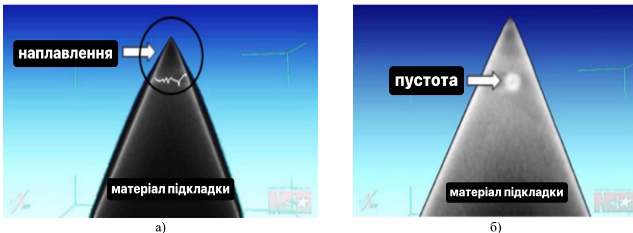
Рисунок 3 – Рентгенівські зображення наплавлення регенераційного покриття: а-б) ніж з гострим краєм

отримували зображення. Рентгенівське зображення наплавлення регенераційного покриття на ріжучу кромку ножа представлено на рис. 3 а. На підставі отриманих рентгенівських зображень регенованих робочих органів аварійно-рятувальних ножиць виявлено кілька внутрішніх дефектів, а саме: пустота із середнім розміром 1,155 мм (рис. 3 б, в). Імовірно утворення пустоти (бульбашки) відбулось через потрапляння повітря під час зварювання.