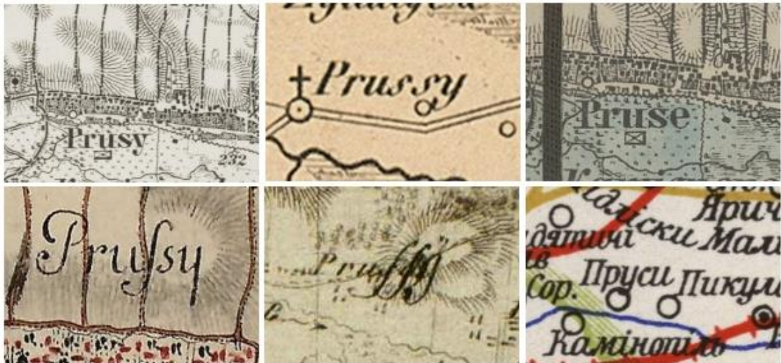
Рис. 3. Варіанти позначення назви Пруси на фрагментах давніх мап

Назва села Пруси на давніх мапах (рис. 3) зустрічається також латинськими літерами в різних варіантах та українсько мовою (Prusy, Pruse, Prussy, Prufsy, Pruffj, Пруси).