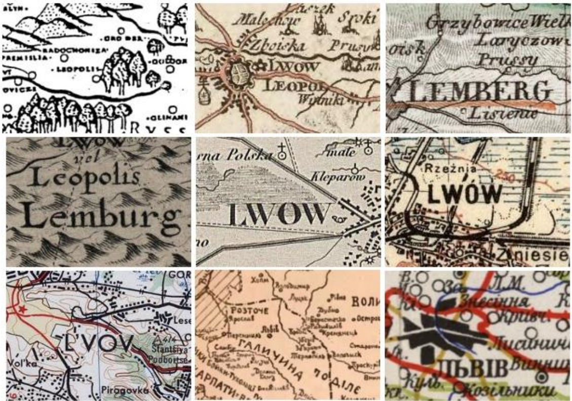
Рис. 2. Варіанти позначення назви Львів на фрагментах давніх мап

Назва села Пруси на давніх мапах (рис. 3) зустрічається також латинськими літерами в різних варіантах та українсько мовою (Prusy, Pruse, Prussy, Prufsy, Pruffj, Пруси).