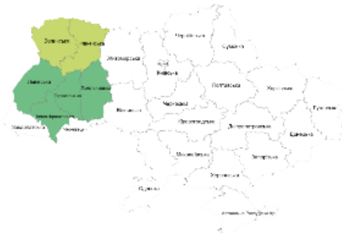
Карта 2. ■ – у великій степені категоричні проти рос. мови ■ – у меншій степені

агресивно ставляться до людей, які вживають ворожу мову і в загальному хочуть прибрати з лексики і спілкування [2].