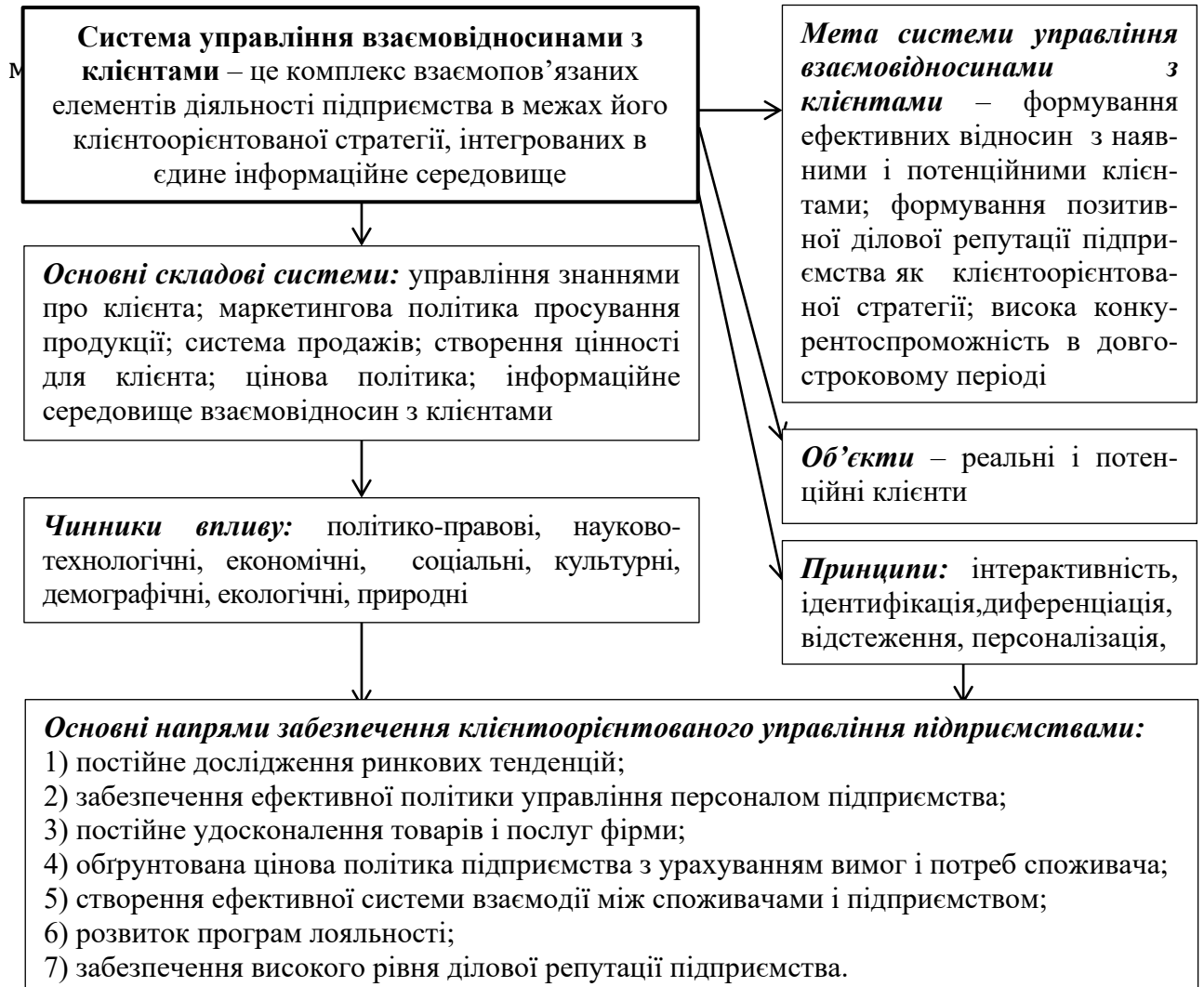
Рис. 1. Система управління взаємовідносинами з клієнтами

спрямовані на формування клієнтського капіталу підприємства" [1, с. 94].