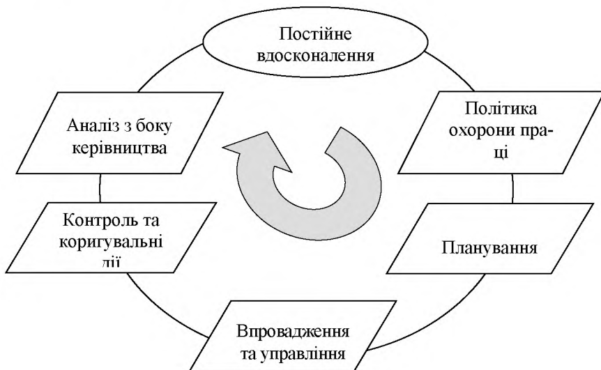
Рисунок 1. Елементи системи управління охорони праці

В системі управління всі принципи мають об'єднувати зусилля структурних підрозділів галузевого об'єкта для вирішення питань промислової безпеки шляхом створення умов для експлуатаційної надійності технічних засобів праці, технологічних процесів, технологічного обладнання, здорових та безпечних умов виробничого середовища.