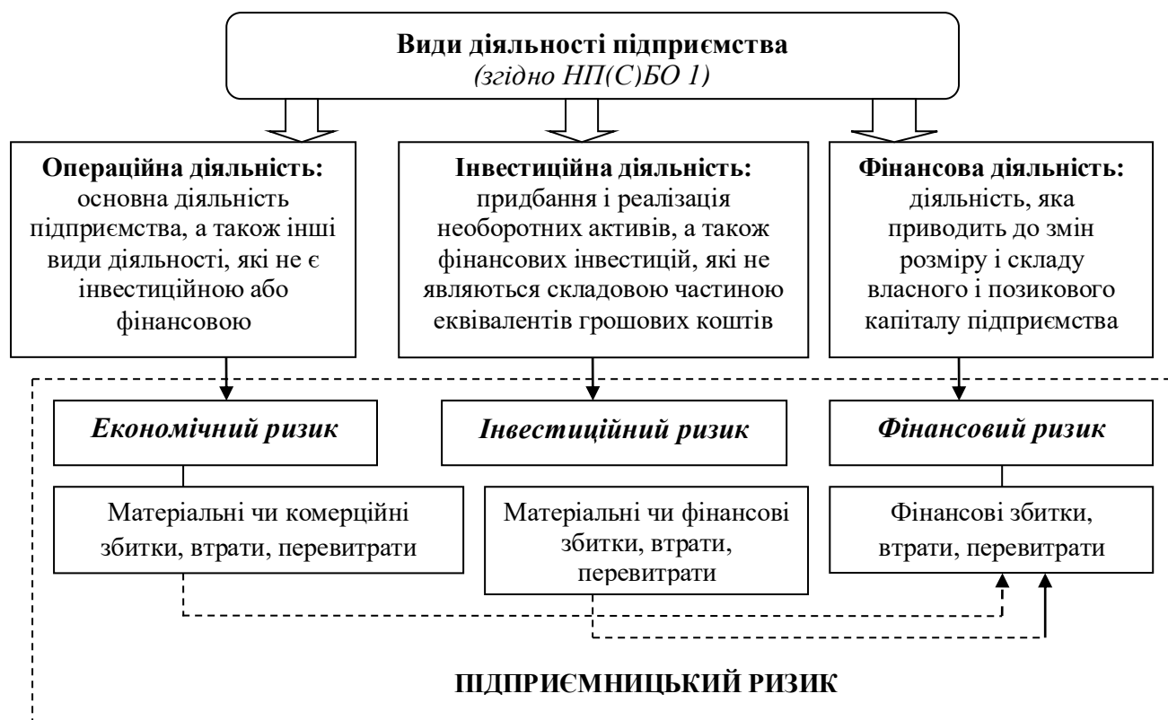
Рис. 2. Види ризику, які виникають у різних видах діяльності підприємства

вимоги до фінансової звітності» [9] – це операційна, інвестиційна та фінансова діяльність. На рис. 2. наведено види ризиків, які проявляються у певному виді діяльності підприємства.