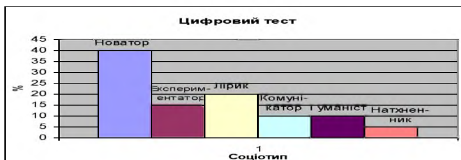
Рис. 1. Результати дослідження визначення психосоціотипу респондентів

З метою визначення психосоціотипу творчої особистості, використовувався цифровий тест «Соціотип» Мегеля – Овчарова, отримані результати: 40% – Новатор (Інтуїтивно – логічний екстраверт), 20% – Лірик (Інтуїтивно – логічний інтроверт) 15% – експериментатори (Логіко – інтуїтивний екстраверт), 10% – Комунікатор (Етико – сенсорний екстраверт), 10% – Гуманіст (Етико – інтуїтивний інтроверт), 5% – Натхненник (Інтуїтивно – етичний інтроверт). Таким чином, можна зробити висновок, що до експериментальної групи увійшли респонденти з перевагою інтуїтивно-логічного психосоціотипу, який характеризується здатністю збирати інформацію довільним чином вбачаючи в ній сенс та знаходячи взаємозв'язок з різними явищами, довіряючи інтуїції, також властива добре розвинена уява та допитливість, що є характерним для творчих особистостей (75%) (див.Рис.1).