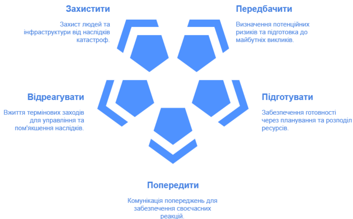
Рисунок 1 – Стратегія стійкості ЄС до катастроф

З моменту свого заснування – UCPM був активований понад 650 разів для реагування на запити про допомогу в надзвичайних ситуаціях, що надходили як від держав ЄС, так із поза його меж. Рішення про активацію UCPM приймається в рамках Координаційного центру з питань надзвичайних ситуацій постраждалої країни. Таке рішення приймається, коли стає очевидним, що масштаби