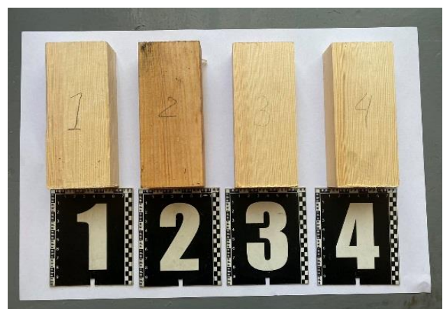
Рисунок 3 – Зовнішній вигляд зразків до випробувань. Зразки піддавались поверхневому пророченню вогнезахисними розчинами: ДСА-1 (зразок №1), ДСА-1 + Біофлейм (зразок №2), ДСА-1 + Еcossept 450-1 (зразок №3), ДСА-1 + Фаєр-off (зразок №4)

Для цього було підготовлено та проведено поверхневе просочування вогнезахисним розчином ДСА-1 12 зразків соснових брусків розмірами 150×60×30 мм. Три зразки залишили обробленими лише розчином ДСА-1 (зразок №1). Інші 9 зразків через 1 місяць після поверхневого просочування вогнезахисним розчином ДСА-1 було просочено розчинами Біофлейм (зразок №2), Еcossept 450-1 (зразок №3) та Фаєр-off (зразок №4) по три зразки кожного відповідно (рис 3).