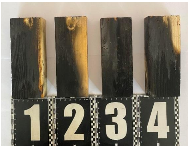
Рисунок 5 – Зразки після випробувань, що піддавались поверхневому просочуванню вогнезахисними розчинами: ДСА-1 (зразок №1), ДСА-1 + Біофлейм (зразок №2), ДСА-1 + Ecossept 450-1 (зразок №3), ДСА-1 + Фаєр-off (зразок №4)

Після проведення експерименту, на підставі втрати маси зразків деревини, що піддавались поверхневому пророченню вогнезахисними розчинами, встановлені для зразка №1 (ДСА-1) втрата маси становила 8,62%, забезпечена I-ша група вогнезахисної ефективності; для зразка №2 (ДСА-1 + Біофлейм) втрата маси – 6,3 %, забезпечена I-ша група вогнезахисної ефективності; для зразка №3 (ДСА-1 + Ecossept 450-1) втрата маси – 37%, вогнезахист не забезпечений; для зразка №4 (ДСА-1 + Фаєр-off) втрата маси – 24 %, забезпечена II-га група вогнезахисної ефективності.