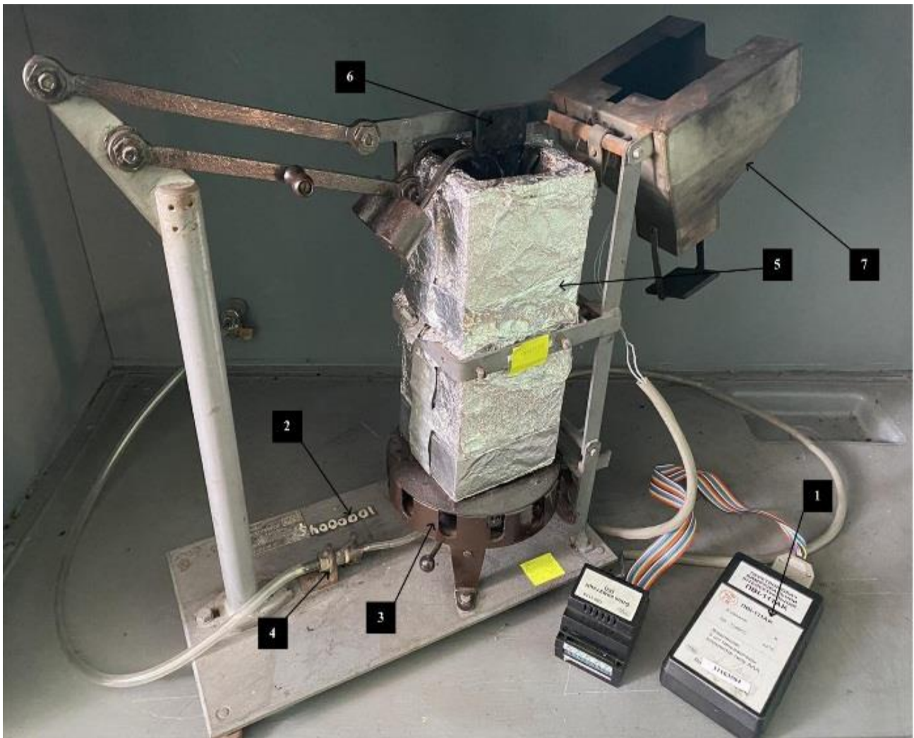
Рисунок 4 – Зовнішній вигляд установки для визначення вогнезахисної ефективності покриттів та просочень: 1 – ПВІ-111АК Перетворювач вимірювальний інтелектуальний з блоком комутації та носієм інформації micro SD; 2 – металева підставка; 3 – газовий пальник; 4 – пристрій для регулювання подачі газу; 5 – керамічний короб; 6 – тримач зразка, що випробовується; 7 – зонт з термопарою

визначення вогнезахисної ефективності покриттів та просочень (рис.4).