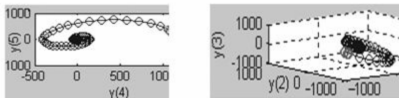
Рис.3. Дво - і тривимірні площини проєкцій відображення фазової траєкторії перебігу процесу в пожежотехнічній системі.

Побудова схем при цьому супроводжується повторенням і вивченням окремих розділів фізики та електротехніки. Це дозволяє свідомо підійти до формування з використанням команд меню Блоки окремих фрагментів схеми електричної принципової.