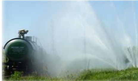
Рисунок 2 – Створення водяної завіси

Наприклад, зменшення розповсюдження НХР досягається створенням водяних завіс (рис. 2), для чого застосовується прилад подачі розпиленої води (рис.3).