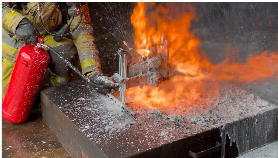
Рисунок 2 – Процес гасіння літій-іонних акумуляторів

Нідерландська методика [10] передбачає випробування переносних вогнегасників на літій-іонних елементах обмеженої ємності, що використовуються в портативній електроніці. Тепловий розгін ініціюється шляхом перезарядження елементів. Однак мала енергетична ємність батарей не створює умов складної пожежі, характерної для реальних випадків (рис. 2).