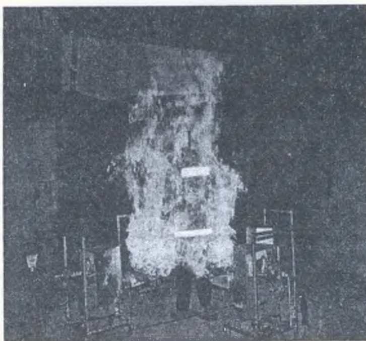
Рисунок 2 - Газові пальники, які використовуються для випробувань захисного одягу.

Сутність даного методу полягає в тому, що захисний виріб, одягнений на манекен, піддається впливу високотемпературного нагріву, що створюється. [4]. Указаний спосіб слід віднести до більш натурних, оскільки одночасно вивчається вплив відкритого полум'я, конвективного тепла та теплового випромінювання. Недоліком рекомендованої методики на нашу думку є те, що відстань манекена із захисним виробом неможливо регулювати до високотемпературного джерела (газових пальників).