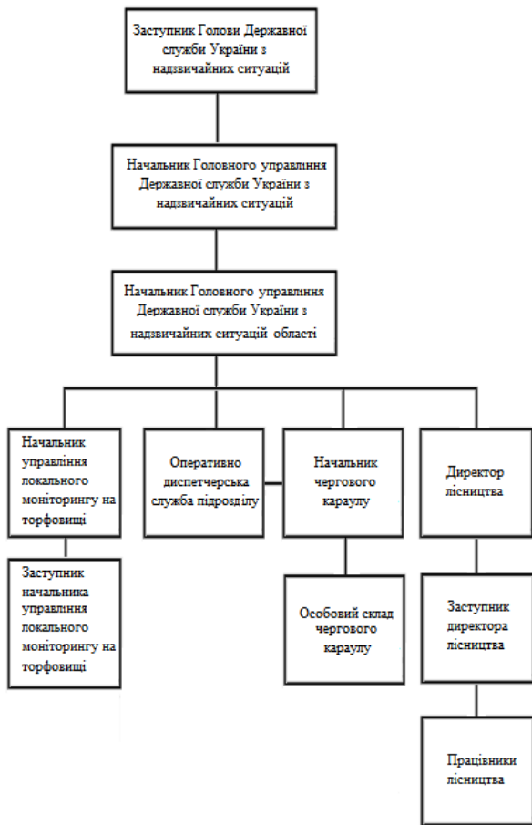
Рис. 1 – Структура керування системою локального моніторингу на торфовищі

результаті якого виникає можливість швидкої