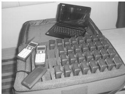
Рис. 1. Комплект інтерактивної діалогової системи Smart Senteo

Для роботи з системою викладачеві необхідно створити свій обліковий запис та зберегти його на жорсткому диску комп'ютера або переносному електронному носіїві. Після цього формуються списки навчальних груп, які можуть бути імпортовані з формату «.xls». Кожному користувачеві (курсанту, студенту) присвоюється ідентифікаційний номер, є можливість введення його електронної адреси та інших реєстраційних даних. Після завершення роботи з системою протоколи зберігаються у файлі викладача або експортуються в формати «.html» чи «.xls». Це дає змогу проводити детальний аналіз успішності групи та рівня засвоєння навчального матеріалу.