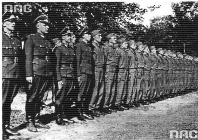
Narodowe Archiwum Cyfrowe, sygn. Z-4700