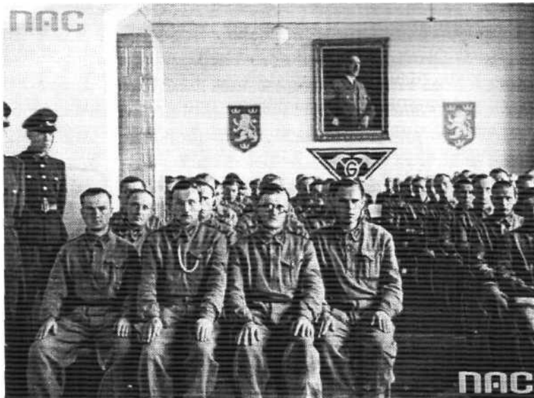
Narodowe Archiwum Cyfrowe, sygn. Z-4701

будівельні табори, в яких працювало по 100-150 молодих хлопців у віці 17-20 літ.