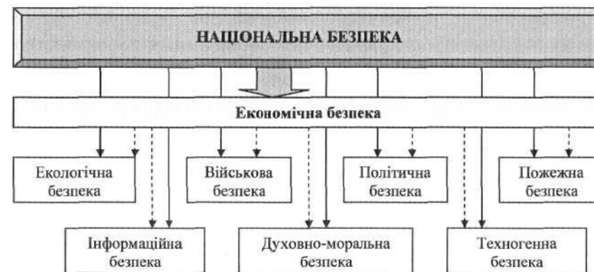
Рис. 1. Структура національної безпеки

розподіл і споживання матеріальних благ первинні для кожної з них і визначають життєдіяльність та життєздатність суспільства, а по-друге, наслідки загроз безпеці в будь-яких сферах можуть бути оцінені з економічного погляду, тобто йдеться про кількісний підрахунок збитків, на основі чого визначається система пріоритетів [8].