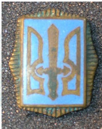
Φοτο Νο 8