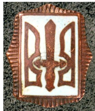
Фото № 6