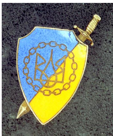
Фото № 1а