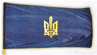
Φοτο Νο 9