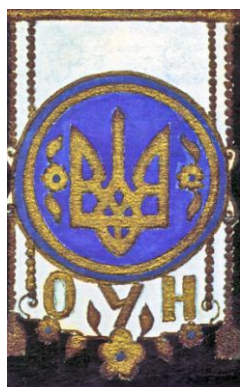
Фото № 4