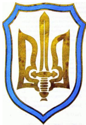
Φοτο Νο 11