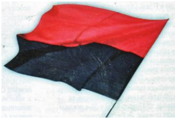
Φοτο Νο 7