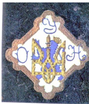
Фото № 5