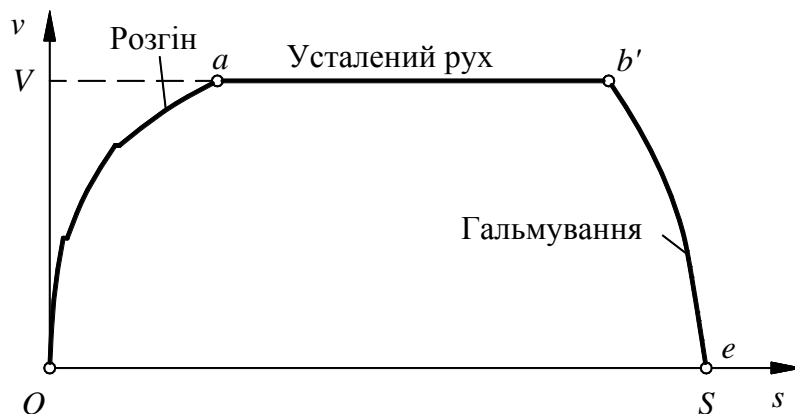
Рисунок 1 — Простий транспортний (перевізний) цикл автомобіля

Виявляється, у разі допустимих S і T величина (6) набуває мінімального значення тоді, коли автомобіль втілює простий цикл Oab'e «якнайінтенсивніший розгін — усталений рух з певною швидкістю V — якнайінтенсивніше гальмування», рис. 1. Скидається на те [8], що саме цю мінімальну плату доквіллю за надану Природою можливість перемістити вантаж доречно вважати корисною роботою, а все, що понад те, слід — шкідливим.