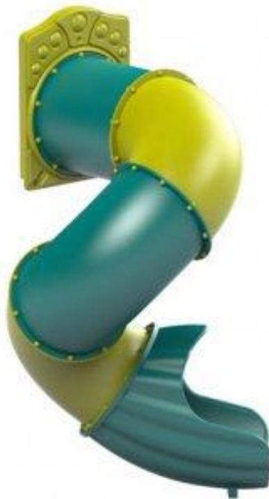
Рис. 2. Спускова труба

Спускова труба (рис.2) дозволяє спуститись пожежнику з будь-якого поверху швидко і без зайвих навантажень на організм, оминаючи такі перешкоди як двері та сходи, що дозволяє зекономити час та зменшити ризик травмування під час руху особового складу приміщеннями будівлі.