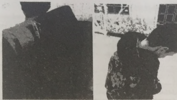
Рисунок 2 – Експериментальний макет використання нагрівного елемента для підвищення температури в підкостюмному просторі

Для дослідження функціонального стану визначено тепловий баланс між теплоутворенням та витратою теплоти. Стан теплового балансу є інтегральним показником терморегуляції організму і здійснюється з метою гігієнічної оцінки мікрокліматичних умов. При розрахунку теплового балансу слід враховувати кількість тепла, що виділяється організмом людини, обмін теплом між організмом людини та навколишнім середовищем способом конвекції. Необхідно також врахувати тепловтрати через одяг [4] та кількість тепла, що виділяється нагрівним елементом. Результати досліджень представлені в таблиці 3.