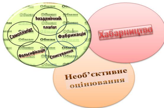
Рис. 1. Види порушень академічної доброчесності

Види порушень академічної доброчесності, зазначені у п. 4, статті 42 Закону України «Про освіту» [5] можна розділити на три основні категорії рисунок 1.