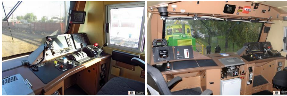
Рис.1 - Вигляд кабін Hyundai і ДПКр2.