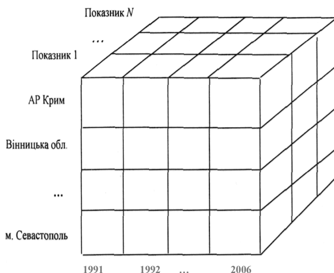
Рис. 1. Модель представлення екологічних показників регіонів України

більше ніж абстракцією. Тим більше, що йдеться не про реальний, а про інформаційний простір, а саме поняття "багатовимірний куб" не що інше як службовий термін, що використовується для опису методу.