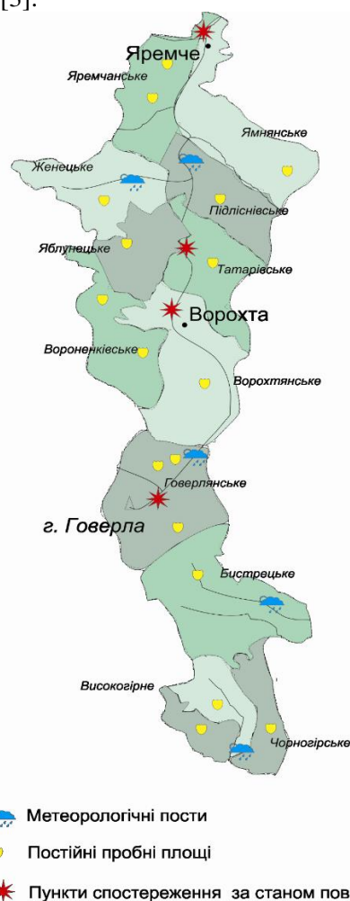
Рисунок 1 – Мережа моніторингових досліджень за станом навколишнього середовища (імпактний моніторинг) на території Карпатського НПП

На території Карпатського НПП створена мережа моніторингових досліджень за станом навколишнього середовища (імпактний моніторинг; рис. 1) [3].