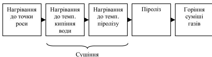
Рис. 1. Фази у процесі горіння лісового горючого матеріалу

Лісовий горючий матеріал будемо розглядати з точки зору здатності до займання та поширення горіння. Під час запалювання матеріалу необхідно подати достатню енергію від джерела запалювання. Ця енергія залежить від виду джерела запалювання. Після займання відбувається надходження енергії від реакції горіння матеріалу. Кожен матеріал характеризується особливою температурою займання. Ця температура залежить від матеріалу, зокрема, його складу, вологості, щільності, а також від характеристик навколишнього середовища температури та відносної вологості повітря, атмосферного тиску. В процесі горіння виділяємо такі фази: нагрівання матеріалу до точки роси, нагрівання від точки роси до температури кипіння води, нагрівання до температури піролізу, піроліз, горіння суміші газів (рис. 1).