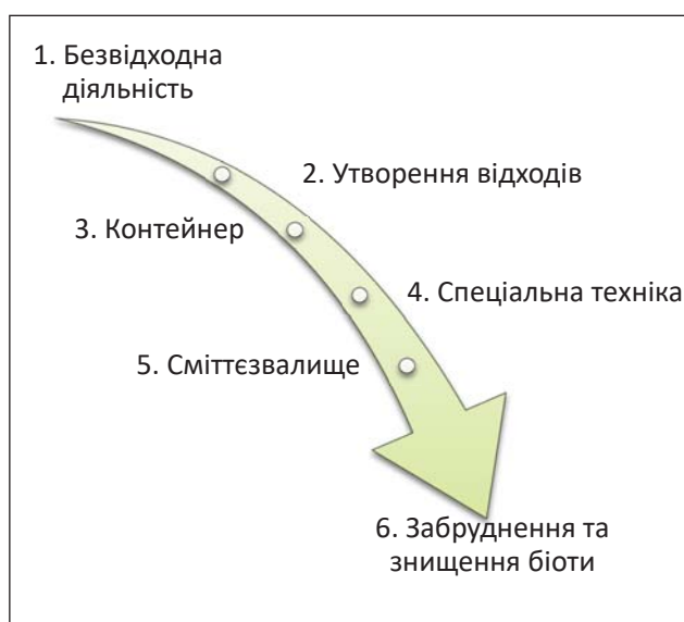
Рис. 1. Зниження регіональної екологічної безпеки внаслідок складування побутових відходів на сміттєзвалищах

Постановка проблеми. Екологічна безпека людства напряму залежить від підходів щодо поводження із відходами. Якщо розвинені країни світу вже давно відмовилися від сміттєзвалищ (а побутові відходи переробляються), то в Україні найбільш поширеним способом поводження залишається складування на відкритій території. Про те, що побутові відходи, які накопичені у звалищах та полігонах спричиняють значне забруднення довкілля та знищення біоти присвячено чимало наукових праць українських та закордонних вчених. Усі вони доходять висновку, що єдиним та найбільш прийнятним способом поводження із відходами є переробка на заводах та використання їх у подальшому як вторинної сировини. В Україні спостерігається тенденція щорічного збільшення обсягів побутових відходів. Внаслідок збільшення об'ємів побутових відходів, відповідно, збільшується кількість сміттєзвалищ. Складування побутових відходів спричиняє зниження регіональної екологічної безпеки (рис. 1).