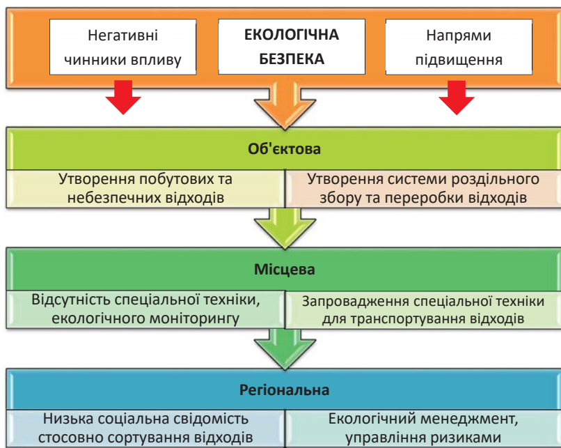
Рис. 4. Чинники впливу та напрями підвищення регіональної екологічної безпеки

Варто зазначити такі спільні риси наукових досліджень: моніторинг зростання рівня екологічної небезпеки найкраще фіксувати на регіональному рівні; неодмінною складовою частиною оцінки екологічної безпеки регіону є міжнародне співробітництво; техногенна складова частина є визначальною у формуванні рівня екологічної небезпеки.