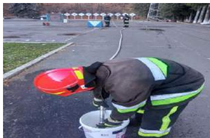
Рисунок 2 - визначенням об'єму рукава діаметром 38 мм

На рисунку 2 показано дослідження №2 з визначенням об'єму рукава діаметром 38 мм