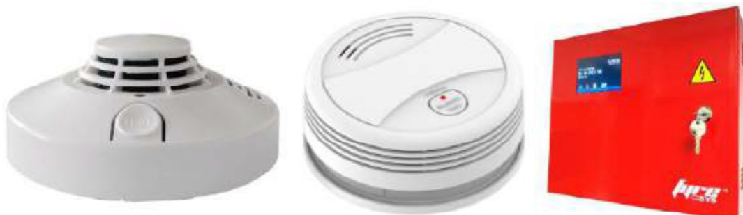
Рисунок 2 – Зовнішній вигляд елементів бездротової WiFi СПС: а) мультисенсорний WiFi ПС фірми PineTree; б) димовий WiFi ПС Pa443W; в) WiFi панель керування фірми PineTree

На рис. 2 показано елементи бездротової WiFi СПС.