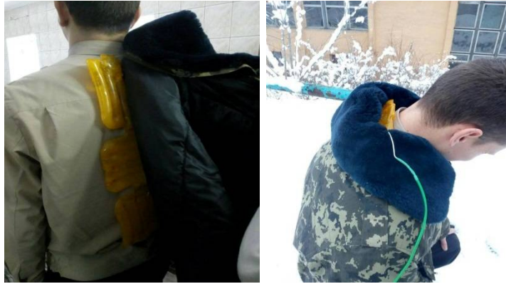
Рисунок 2 – Експериментальний макет використання нагрівного елемента для підвищення температури в підкостюмному просторі

Для дослідження функціонального стану визначено тепловий баланс між теплоутворенням та витратою теплоти. Стан теплового балансу є інтегральним показником терморегуляції організму і здійснюється з метою гігієнічної оцінки мікрокліматичних умов. При розрахунку теплового балансу слід враховувати кількість тепла, що виділяється організмом людини, обмін теплом між організмом людини та навколишнім середовищем способом конвекції. Необхідно також врахувати тепловтрати через одяг [4] та кількість тепла, що виділяється нагрівним елементом. Результати досліджень представлені в таблиці 3.