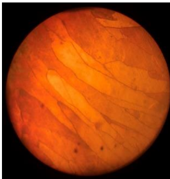
Рисунок 3 – Мікроструктура мідного провідника з ознаками короткого замикання в звичайних умовах.