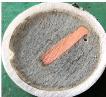
Рисунок 1 – Шліф протравлений

З метою дослідження відмінностей мікроструктури мідного дроту із ознаками короткого замикання за різних температурних умов було проведено експериментальні металографічні дослідження із визначення відмінностей мікроструктури мідних дротів кабельно-провідникової продукції, а саме мідний дріт перерізом 2,5 мм 2 після коротких замикань в різних температурних умовах. Металографічні дослідження мікроструктури кристалітів міді проводили на шліфах, які були виготовленні за спрощеною методикою. Взірці дроту із ознаками короткого замикання розміщали в алюмінієві круглі форми і заливали розплавленою сіркою (S), після затвердіння зразки шліфували на абразивному папері різної зернистості та полірували за допомогою алмазної пасту, а також поверхню шліфа протравлювали нанесенням на поверхню різних травників з метою виявлення структури (рис.1).