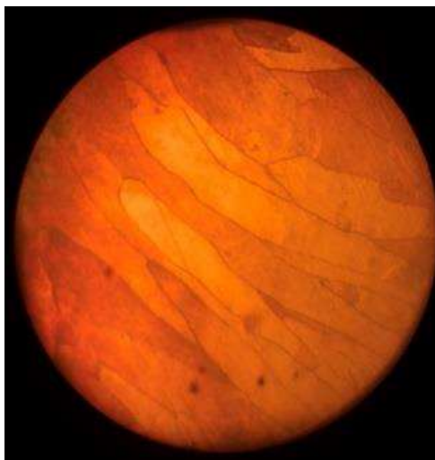
Рисунок 3 – Мікроструктура мідного провідника з ознаками короткого замикання в звичайних умовах.