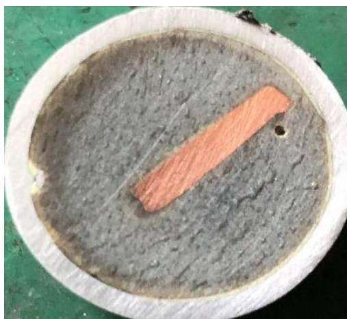
Рисунок 1 – Шліф протравлений

З метою дослідження відмінностей мікроструктури мідного дроту із ознаками короткого замикання за різних температурних умов було проведено експериментальні металографічні дослідження із визначення відмінностей мікроструктури мідних дротів кабельно-провідникової продукції, а саме мідний дріт перерізом 2,5 \text{ мм}^2 після коротких замикань в різних температурних умовах. Металографічні дослідження мікроструктури кристалітів міді проводили на шліфах, які були виготовленні за спрощеною методикою. Взірці дроту із ознаками короткого замикання розміщали в алюмінієві круглі форми і заливали розплавленою сіркою (S), після затвердіння зразки шліфували на абразивному папері різної зернистості та полірували за допомогою алмазної пасти, а також поверхню шліфа протравлювали нанесенням на поверхню різних травників з метою виявлення структури (рис.1).