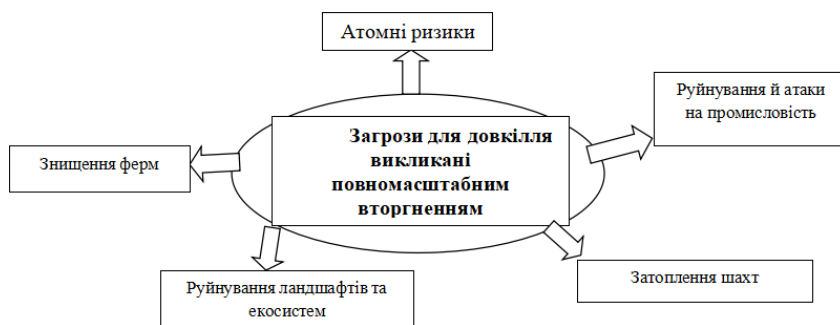
Рисунок 1.1 Загрози для довкілля викликані повномасштабним вторгненням

У зв'язку з повномасштабним вторгненням в Україну спостерігаються катастрофічні наслідки впливу на навколишнє середовище. Так, директорка ГО «Екодія» Наталія Гозак виділяє п'ять найбільших груп загроз для довкілля [2], спричинених повномасштабним вторгненням рис.1.1.