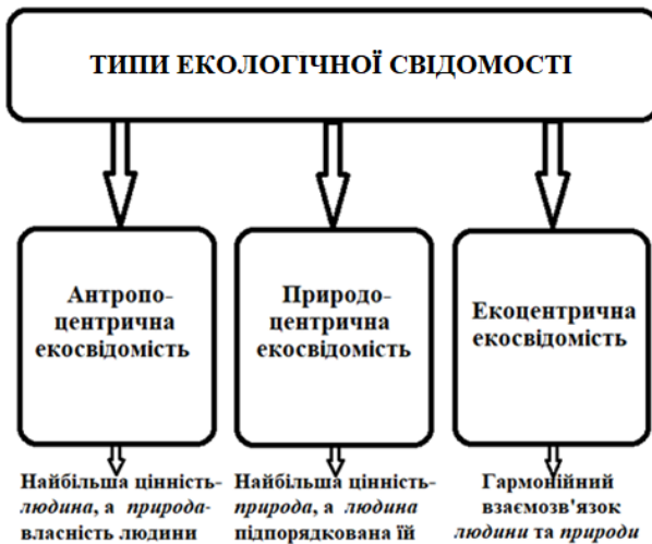
Рис. 1. Типи екологічної свідомості

Екологічно орієнтований світогляд повинен формуватися та підтримуватися постійно. І ключова роль у цьому процесі відводиться системі освіти упродовж усього життя. Тому, у найважливіших міжнародних документах останніх десятиліть, присвячених проблемам навколишнього середовища і гармонійного розвитку людства, особлива увага приділяється екологічній освіті, культурі та свідомості, інформованості людей про екологічні ситуації, їхній обізнаності з можливими шляхами вирішення різних екологічних проблем. А осередками екологічної освіти, цілеспрямованого впливу на світогляд і поведінку населення повинні бути установи природно-заповідного фонду, профільні навчальні заклади, спеціалізовані центри.