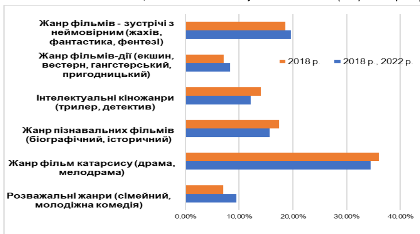
Діаграма 2. Соціологічний аналіз емпіричного матеріалу щодо кіновподобань студентської молоді (жанрові напрями)

Подібні хоч не надто значні зміни у кіно-уподобаннях студентської молоді, на нашу думку, можуть бути