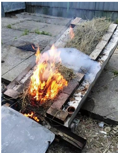
Рисунок 3 – Поширення вогню по експериментальній трав'яній смузі та загороджувальна смуга із піноутворювача підвищеної стійкості для гасіння пожеж «Барс S-2»

Суттєвий інтерес представляє вивчення температурного режиму горіння трав'яного покриття за впливу різних факторів, зокрема кута ухилу та швидкості вітру, вологості, температури навколишнього середовища. Показано, що температура полум'я за найсприятливіших умов для горіння виміряна термопарами та пірометром відповідно становить 674 та 647 °С, причому ці значення є максимальними під час усього процесу горіння досліджуваної трав'яної смуги. Як видно, два різні прилади дають приблизно однакову максимальну температуру полум'я, при цьому похибка між їх показами становить лише 4%. Крім того, під час горіння трав'яного покриття за максимальної температури полум'я на відстані 50 см був зафіксований тепловий потік величиною 19,74 кВт/м 2 . Для створення перешкод поширенню вогню по трав'яних смугах створювали загороджувальні смуги піноутворювачем підвищеної стійкості для гасіння пожеж «Барс S-2» (рис. 3) різної висоти та ширини.