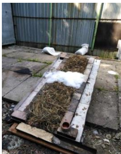
Рисунок 1 – Трав'яний покрив, створений в полігонних умовах для проведення експериментальних досліджень, із загороджувальною смугою з піноутворювача підвищеної стійкості для гасіння пожеж «Барс S-2»

В цих дослідженнях оцінювалась придатність піноутворювача підвищеної стійкості для гасіння пожеж «Барс S-2» створювати загороджувальні смуги на трав'яних покривах. У полігонних умовах створювалась трав'яна смуга довжиною 2 м, шириною 40 см та висотою 21 см на спеціальній платформі (рис. 1).