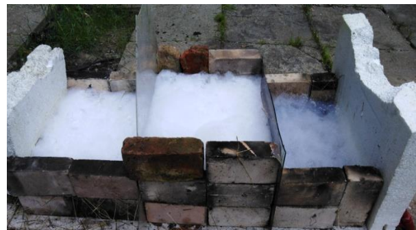
Рисунок 4 – Піна нанесена висотою 10, 15 та 20 см в трьох різних секціях

Ці дослідження, як уже зазначалось вище, проводились за найсприятливіших умов для поширення полум'я. Для початку провели дослідження стійкості піни на сухому трав'яному покритті у природних умовах за температури навколишнього середовища 22 °С у напівсонячний день. Піну нанесли на створений у трьох розділених секціях трав'яний покрив. Висота шарів піни відповідно 10, 15 та 20 см (рис. 4).