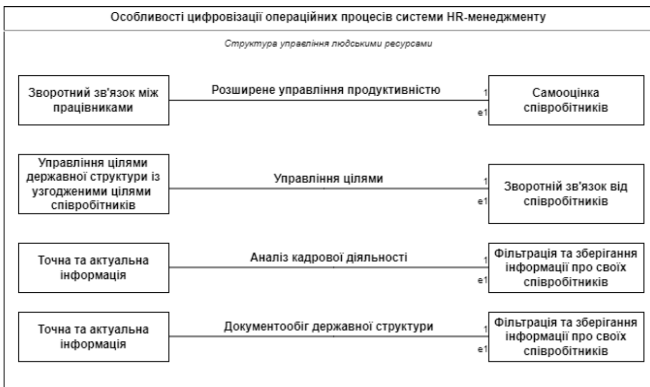
Рисунок 1 – Особливості цифровізації операційних процесів системи HR-менеджменту у сфері цивільного захисту

Результати досліджень. За останній рік, в умовах війни, управління персоналом державних структур стало свідком однієї з найрадикальніших змін у тому, як ми працюємо, комунікуємо, передаємо, отримуємо та шукаємо інформацію про особовий склад. Причина впровадження інформаційних технологій в управління людськими ресурсами державних структур полягає в двох ключових словах: ефективність і стійкість. Перше дозволяє організаціям краще задовольняти потреби працівників, що постійно змінюються, а друге — бути все більш адаптивними та чутливими до раптових змін.