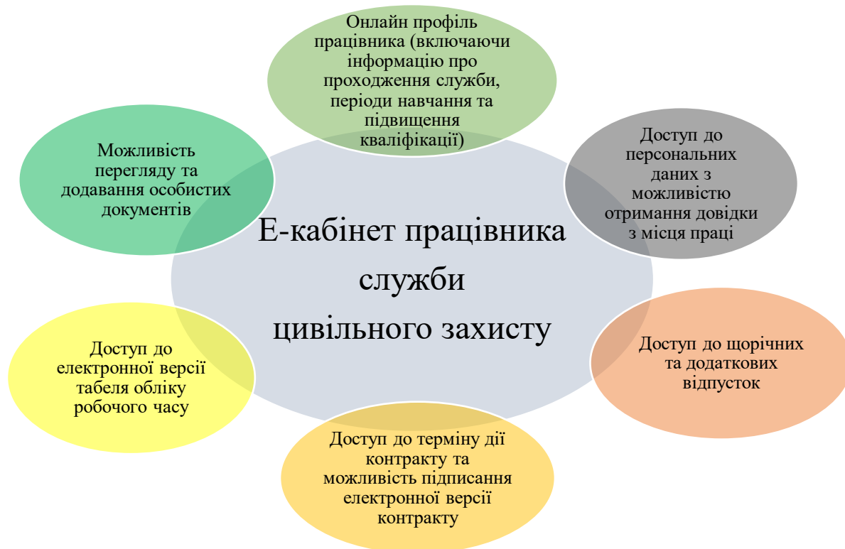
Рисунок 4 – Основні модулі програмного забезпечення управління персоналом у сфері цивільного захисту

власного профілю. Вона також дасть змогу працівникам отримувати доступ до своїх особистих файлів через безпечне підключення до Інтернету, додавання особистих документів, доступу до електронного кадрового документообігу. За задумом, Е-кабінет працівника служби цивільного захисту потрібен для підтримки державної структури всередині і розвитку цифрового середовища. Незалежно від того, чи перебуває працівник в місті, чи в області, він матиме змогу зайти в електронний профіль локально, що прискорить прийняття рішень, підвищить ефективність і оперативність особового складу.