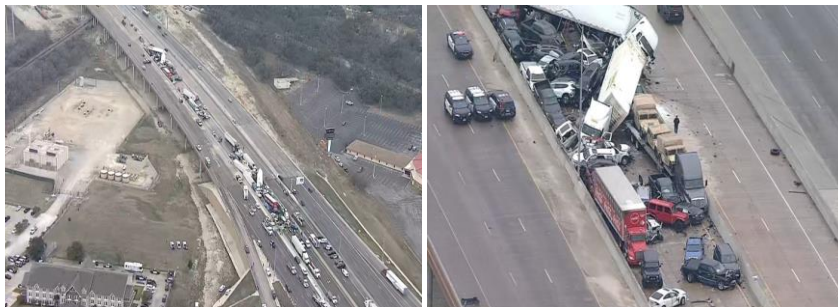
Рис. 16. Масштабна аварія в Техасі

11 лютого 2021 року сталась масштабна аварія в Техасі, де на автостраді зіткнулися більш як 130 машин. Взимку крижаний дощ перетворив швидкісну трасу на суцільну ковзанку. Через ожеледицю з кермуванням не впорався водій вантажівки. Фура протаранила кілька авто, які рухалися попереду. Інші водії теж не встигли загальмувати. Внаслідок ДТП загинуло 6 осіб та 36 госпіталізовано.