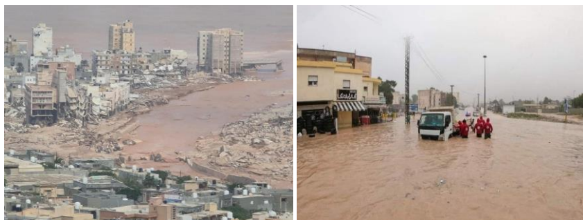
Рис. 6. Шторм Даніель 9 вересня 2023 року – смертоносний середземноморський циклон, який завдав катастрофічної шкоди Лівії й торкнувся деяких районів Південно-Східної Європи, де загинуло більше 11000 осіб, а ще 34000 – були змушені залишити свої домівки

Велику небезпеку становлять землетруси, яких на земній кулі буває близько 1 млн на рік, тобто, кожних дві хвилини на Землі відбувається землетрус. При цьому, великих землетрусів нараховують близько двадцяти протягом року, один-два з яких мають характер катастрофи. На землетруси припадає 1/8 всіх жертв, якими супроводжуються всі види стихійних лих. Землетруси супроводжуються зміщенням ґрунту від сейсмічних або тектонічних рухів поверхні земної кори, провалами ґрунту, зсувами, тріщинами, природними пожежами, сходженням снігових та кам'яних лавин.