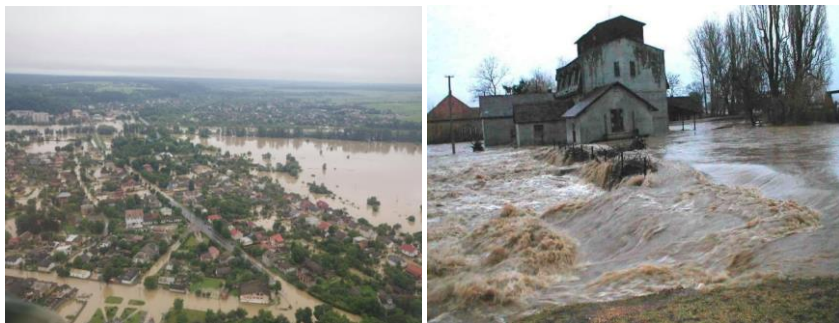
Рис. 10. Повінь 2020 року на заході України

Так, інтенсивні опади в Україні протягом 22-24 червня 2020 року призвели до ускладнення паводкової обстановки в Івано-Франківській, Чернівецькій, Львівській, Закарпатській та Тернопільській областях. Станом на 25 червня було підтоплено: 285 населених пунктів (Івано-Франківська – 234, Чернівецька – 37, Львівська – 12, Тернопільська – 2); 9994 будинки (Івано-Франківська – 9157, Чернівецька – 728, Львівська – 72, Тернопільська – 37); 9 об'єктів соціальної та побутової сфери; зруйновано 117 км автодоріг (Івано-Франківська – 116, Чернівецька – 1), 64 мости в Івано-Франківській області; пошкоджено 500 км автодоріг і 135 мостів (Івано-Франківська – 487 км доріг і 118 мостів, Львівська – 2 км автодоріг, Чернівецька – 12 км доріг та 17 мостів) і 280 м дамб у Чернівецькій області.