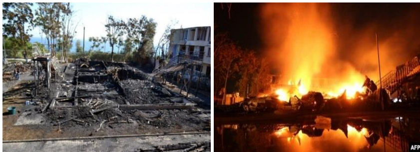
Рис. 17. Пожежа в оздоровчо-спортивному таборі «Вікторія» м. Одеса

16 вересня 2017 року близько 23:30 год виникла пожежа в муніципальному дитячому оздоровчо-спортивному таборі «Вікторія» м. Одеса. Вогонь повністю знищив двоповерховий дерев'яний будинок, в якому на момент пожежі перебували 42 дитини, троє з них померли.