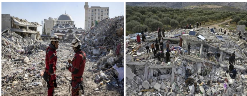
Рис. 8. Землетрус у Туреччині

12 січня 2010 року о 16 годині 53 хвилини за місцевим часом на Гаїті стався землетрус магнітудою 7 балів з епіцентром в південно-західній частині острова, який привів до руйнації більшої частини столиці країни і загибелі 222 570 людей. Було зруйновано багато видатних пам'яток архітектури: президентський палац, будівлю парламенту, головного собору в Порт-о-Пренсі та головну тюрму.