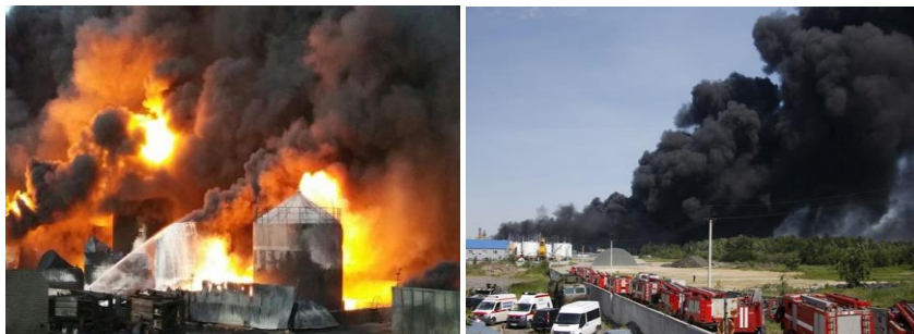
Рис. 15. Пожежа на нафтобазі БРСМ

урожай, який або згорів, або виявився непридатним до споживання, загинули домашня худоба і птиця. Крім того, вода в колодязях стала непридатною до споживання.