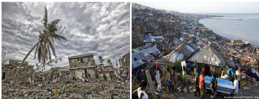
Рис. 3. Ураган Метью – потужний тропічний цикллон у західній частині Атлантики і Карибському морі, який спостерігали з 28 вересня по 10 жовтня 2016 року.

Надзвичайні ситуації природного характеру виникають внаслідок дії стихійних сил природи: землетрусів, повеней, тайфунів та смерчів, виверження вулканів, цунамі, снігових заносів та лавин, епідемій інфекційних захворювань.