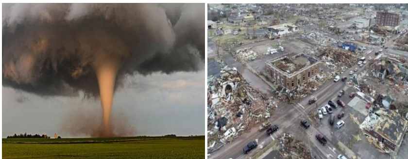
Рис. 4. Торнадо у США 10-11 грудня 2021 року, де постраждали шість штатів та, за попередніми оцінками, загинуло понад 100 людей