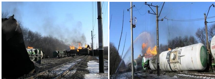
Рис. 13. Пожежа на залізниці

2 лютого 2014 року в Донецькій області на залізничному перегоні Вдале-Межова Красноармійського району, під час проходження вантажного потяга з 62 цистернами з пропан-бутаном зійшли з колії 25 цистерн. Пізніше вони перекинулися, дві цистерни вибухнули, а 5 загорілося. Пожежі було присвоєно третій, підвищений рівень небезпеки. У гасінні пожежі брали участь 15 одиниць пожежної техніки та 3 пожежних потяги.