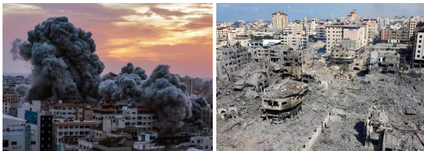
Рис. 20. Терористичні обстріли Ізраїлю бойовиками ХАМАС

7 жовтня 2023 року терористи з організації ХАМАС випустили тисячі ракет по Ізраїльській території із сектору Газа. Одночасно на територію Ізраїлю увірвались диверсійні групи. Під прицілом опинився південь і центр країни, включно з Тель-Авівом. Радикальне палестинське угруповання ХАМАС оголосило про початок операції під назвою Потоп Аль-Акси проти Ізраїлю. У країну змогли проникнути бойовики, в деяких містах точились вуличні бої.