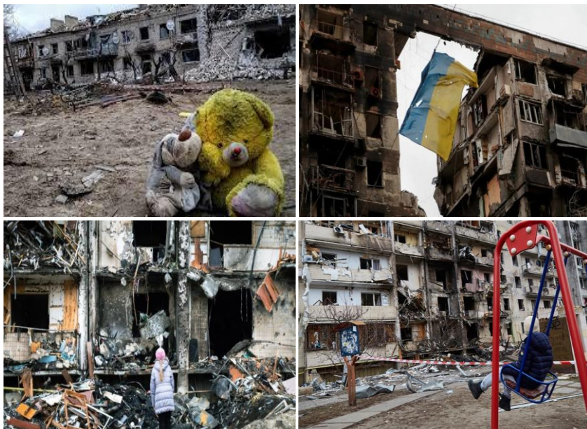
Рис. 18. Наслідки збройних обстрілів України

ракетами наземного, повітряного, надводного і підводного базування, ракетними системами залпового вогню, артилерією і авіацією не лише військових об'єктів, а й житлових кварталів, дитячих садочків, закладів освіти, лікарень та об'єктів критичної інфраструктури. Наприклад, російські фашисти 10 жовтня 2022 р. здійснили масований удар ракетами і дронами по критичній інфраструктурі населених пунктів по всій території України, випустивши в короткий період 83 ракети. Наслідки цього масованого удару були жахливими, але силами підрозділів ДСНС України вдалось у цілому їх ліквідувати та відновити забезпечення населенню насамперед електроенергії, води і газу. В цей час фахівці з НС здійснювали ліквідаційні заходи в дуже складних екстремальних умовах, часто під вогнем противника, на замінованих територіях і об'єктах, в яких існувала небезпека подальших руйнувань, вибухів і завалів, витоків небезпечних речовин тощо.