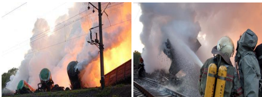
Рис. 12. Залізнична аварія на перегоні Красне-Ожидів. Вагони з жовтим фосфором

2 лютого 2014 року в Донецькій області на залізничному перегоні Вдале-Межова Красноармійського району, під час проходження вантажного потяга з 62 цистернами з пропан-бутаном зійшли з колії 25 цистерн. Пізніше вони перекинулися, дві цистерни вибухнули, а 5 загорілося. Пожежі було присвоєно третій, підвищений рівень небезпеки. У гасінні пожежі брали участь 15 одиниць пожежної техніки та 3 пожежних потяги.