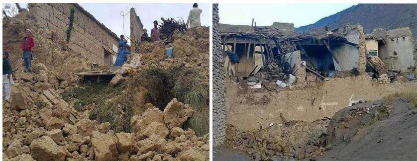
Рис. 7. Землетрус в Афганістані

У результаті потужного землетрусу в Афганістані в провінції Патики 22 червня 2022 року загинуло близько 1000 людей та 600 отримали різні травми. Землетрус стався приблизно за 44 км від міста Хост, поблизу пакистанського кордону, на глибині 51 км. Щонайменше 100 будинків було зруйновано.