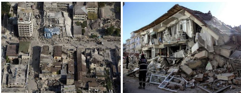
Рис. 9. Землетрус на Гаїті

12 січня 2010 року о 16 годині 53 хвилини за місцевим часом на Гаїті стався землетрус магнітудою 7 балів з епіцентром в південно-західній частині острова, який привів до руйнації більшої частини столиці країни і загибелі 222 570 людей. Було зруйновано багато видатних пам'яток архітектури: президентський палац, будівлю парламенту, головного собору в Порт-о-Пренсі та головну тюрму.