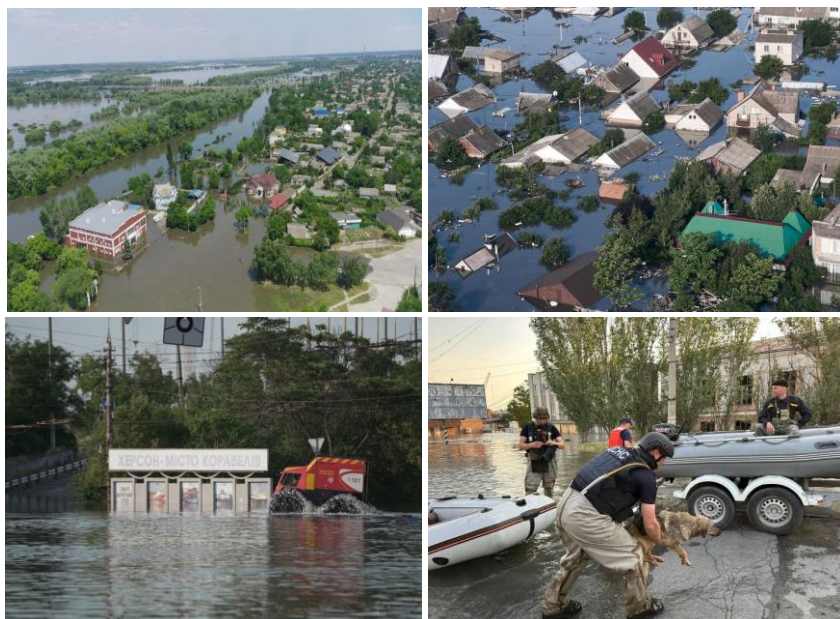
Рис. 19. Затоплення півдня України внаслідок підриву росіянами Каховської ГЕС 06 червня 2023 року

Знищення греблі Каховської гідроелектростанції (Каховська катастрофа) – воєнний злочин та потенційно акт екоциду, здійснений окупаційними силами близько 2:50 ночі 6 червня 2023 року під час російського вторгнення в Україну. Найімовірніше, греблю Каховської ГЕС було заміновано та підірвано, що призвело до її знищення. У зоні лиха опинилося близько 16000 людей, та близько 80 населених пунктів, частина з яких були затоплені внаслідок теракту. Масштабна екологічна катастрофа, спричинена руйнуванням греблі, є актом екоциду в результаті зумисності дії. Екоцид – масове знищення рослинного та тваринного світу, отруєння атмосфери та водних ресурсів – того, що може спричинити екологічну катастрофу. За міжнародним законодавством це є воєнним злочином, оскільки руйнування гребель прямо заборонене навіть у разі, якщо вони є військовими об'єктами.