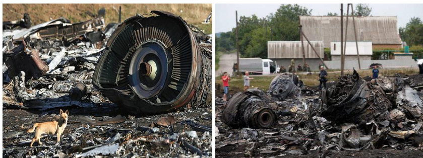
Рис. 14. Катастрофа Boeing 777 у Донецькій області

авіакомпанії Malaysia Airlines виконував плановий рейс МН17 за маршрутом Амстердам – Куала-Лумпур, але приблизно через 2 години і 49 хвилин після зльоту був уражений ракетою серії 9М38, випущеною з зенітно-ракетного комплексу, який належав 53-й бригаді ППО ЗС Росії. Уламки лайнера впали на землю в районі населених пунктів Грабове, Розсипне та Петропавлівка (Донецька область, Україна). Загинули всі 298 осіб, що знаходилися на його борту, – 283 пасажери і 15 членів екіпажу. Катастрофа рейсу МН17 увійшла до десятки найбільших авіакатастроф за всю історію і стала найбільшою авіакатастрофою на пострадянському просторі.