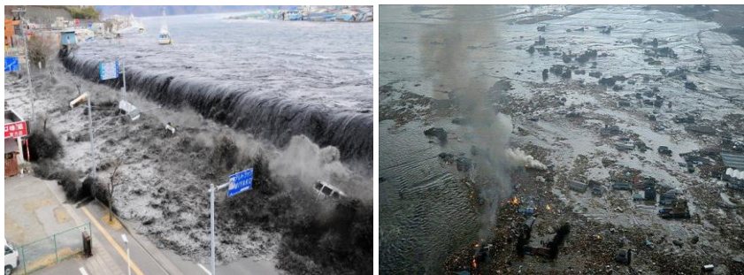
Рис. 5. Цунамі в місті Міяко, Японія, 11 березня 2011 року