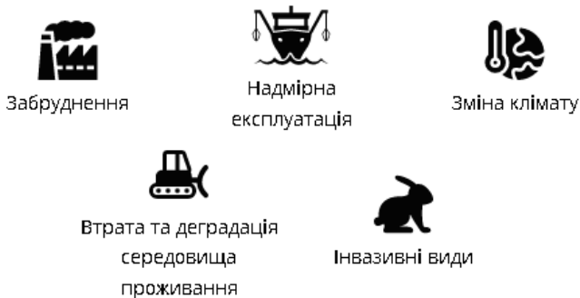
Рисунок 3.1 – Сучасні загрози біорізноманіттю

Зменшення екосистемного різноманіття. Основні сучасні загрози екосистемного біорізноманіттю показано на рис. 3.1.