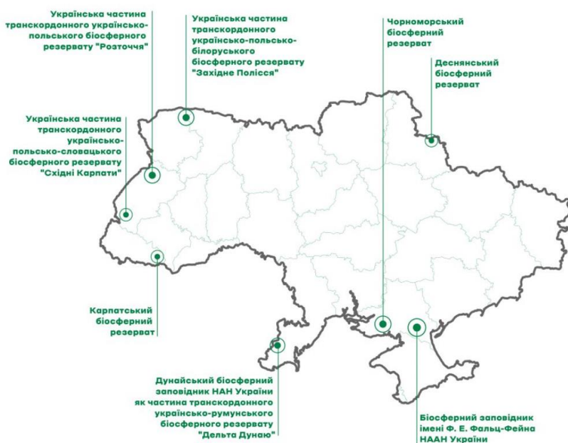
Рисунок 5.2 – Національна мережа біосферних резерватів