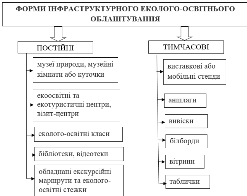
Рисунок 11.1 – Форми інфраструктурного еколого-освітнього облаштування

Для здійснення екологічної освітньо-виховної роботи в установах ПЗФ створюються постійні і тимчасові форми інфраструктурного еколого-освітнього облаштування (рис.11.1).