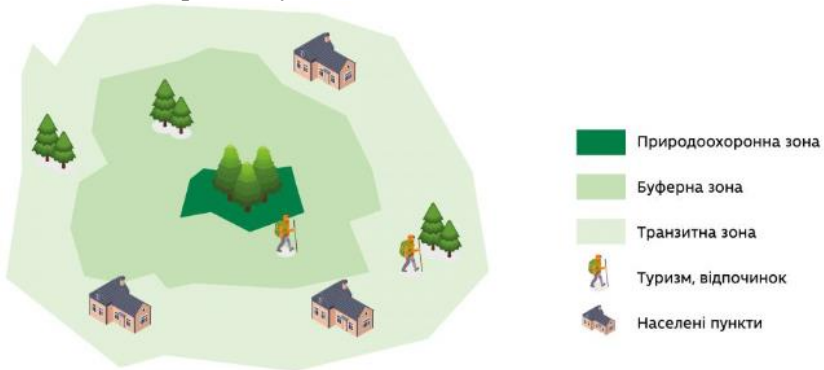
Рисунок 5.1 – Зони біосферного резервату

• транзитна зона (Transition) – зона з поселеннями, в якій здійснюється управління різними видами природокористування на засадах сталого розвитку.