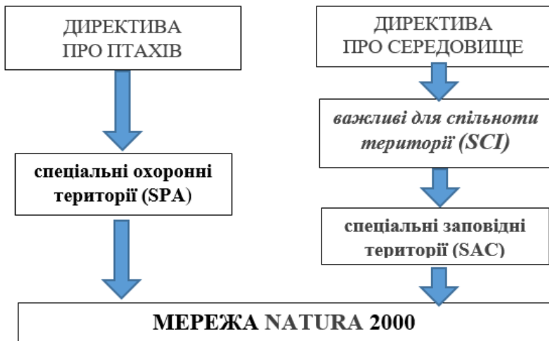
Рисунок 6.1 – Структура екологічної мережі «Natura 2000»

Разом спеціальні охоронні території (SPA) та спеціальні заповідні території (SAC) формують екологічну мережу «Natura 2000» (рис. 6.1).