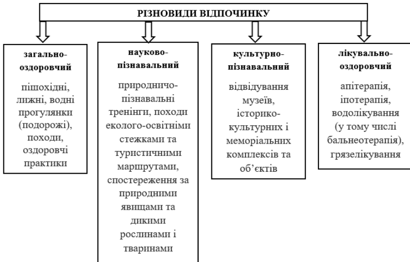
Рисунок 12.1 – Різновиди відпочинку

Любительське та спортивне рибальство охоплює вилов риби і добування водних безхребетних у визначених місцях території або об'єкта ПЗФ і може здійснюватися лише за умови, що така діяльність не суперечить цільовому призначенню території або об'єкта ПЗФ, встановленим вимогам щодо охорони, відтворення та використання їх природних комплексів та окремих об'єктів.