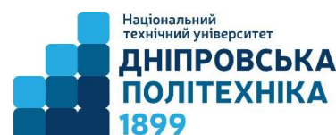
Національний технічний університет «Дніпровська політехніка»