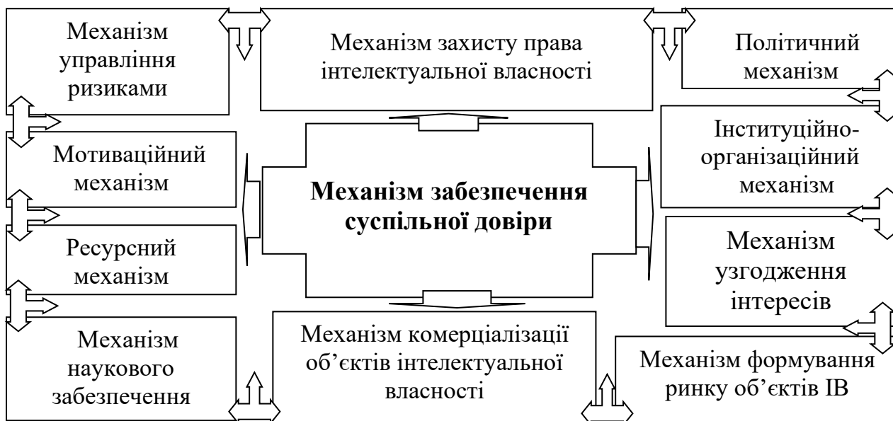
Рис.1. Комплексна модель механізмів державного регулювання у сфері ІВ

Водночас варто виокремити гальмуючі чинники модернізації механізмів державного регулювання у сфері ІВ, зокрема: