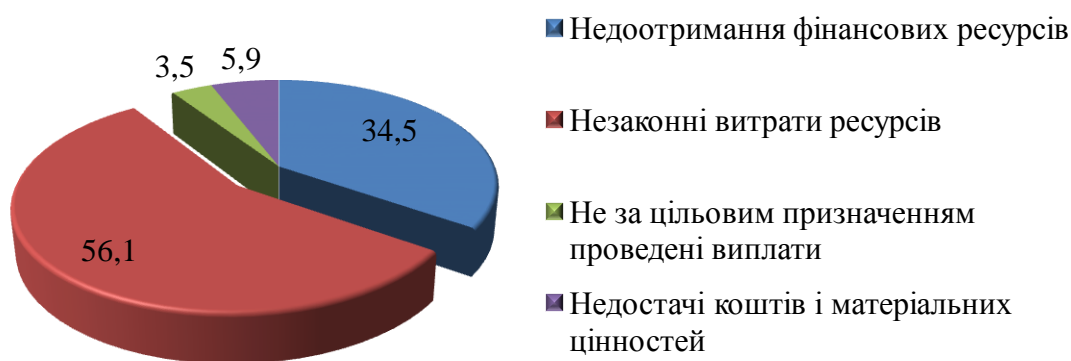
Рис. 1. Структура порушень, що призвели до втрат фінансових і матеріальних ресурсів, виявлених органами Держфінінспекції за 2013 рік

Основні порушення, що призвели до втрат фінансових і матеріальних ресурсів за 2013 рік зобразимо на рис. 1.