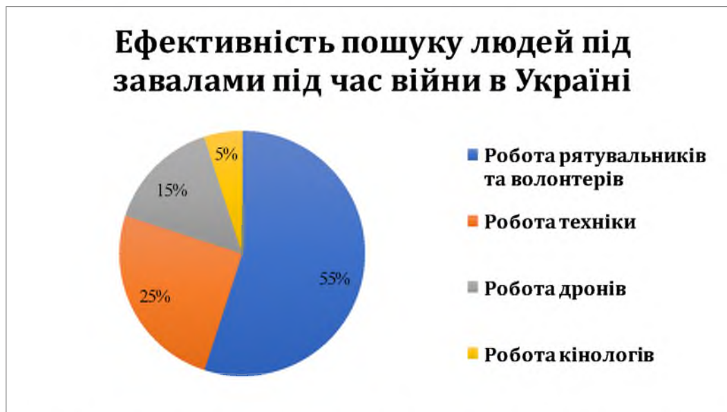
Рис. 3. Ефективність різних технологій у пошуку людей під завалами під час війни в Україні

Ця діаграма, ілюструє ефективність різних технологій та підходів у пошуку людей під завалами під час війни в Україні. Найбільший внесок роблять рятувальники та волонтери - 55%, ефективність застосування техніки складає - 25%, а робота дронів - 15%, найменш ефективні в пошуку за даними статистичних даних є кінологи, робота яких складає - 5%, але кожен із цих елементів відіграє важливу роль у порятунку постраждалих у складних умовах.