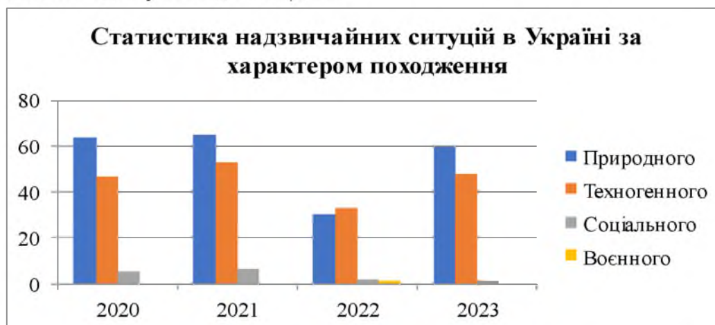
Рис. 1. Статистика надзвичайних ситуацій в Україні за характером походження в період з 2020 до 2023 року

Згідно даних статистики [1] у період з 2020 по 2023 рік в Україні спостерігалася значна кількість виникнення надзвичайних ситуацій (далі - НС). У 2020 році було зареєстровано 116 надзвичайних ситуацій, з яких 64 ситуації були природного, 47 - техногенного та 5 - соціального характеру. У 2021 році кількість надзвичайних ситуацій зросла до 124, в основному через збільшення природних та техногенних інцидентів, зокрема, до 65 НС природного характеру та 53-х техногенного характеру. У 2022 році спостерігалось зменшення природних надзвичайних ситуацій до 30, а техногенних до 33 та виникнення однієї надзвичайної ситуації воєнного характеру. У 2023 році кількість природних та техногенних надзвичайних ситуацій знову зросла в порівнянні з 2022 роком до 60-и і 48-и відповідно. На рисунку 1 показано описані вище статистичні дані у вигляді гістограми.