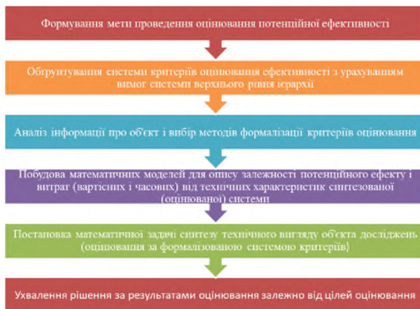
Рис. 4. Блок схема процесу оцінки потенційної ефективності використання БпЛА

Узагальнюючи вищезазначене, процес оцінки потенційної ефективності використання дронів, як складної технічної системи, можна схематично представити блок схемою, що наведена на рисунку 4.