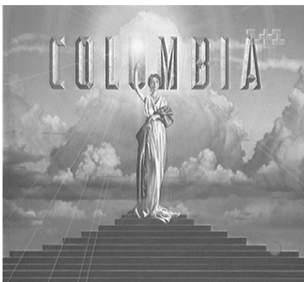
Рис. 6. Дешифроване зображення