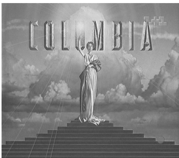
Рис. 4. Початкове зображення

Результати наведено на рис. 1 – 3 при P = 127, Q = 53 .