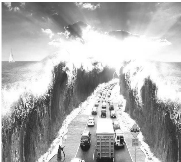
Рис. 3. Дешифроване зображення

Результати наведено на рис. 1 – 3 при P = 127, Q = 53 .