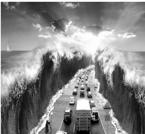
Рис. 1. Початкове зображення

Результати наведено на рис. 1–3, при P = 53, Q = 83 .