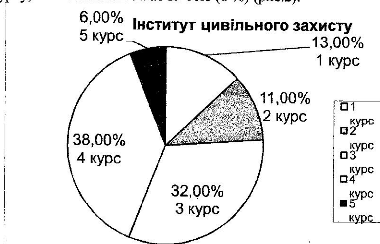
Рис. 2. Відвідуваність самостійних занять в спортивно-атлетичному центрі ЛДУБЖД курсантами та студентами ІЦЗ за курсами

Якщо проаналізувати відвідування спортивно-атлетичного центру курсантами та студентами інституту цивільного захисту то слід зауважити, що найактивнішими є курсанти та студенти 4-го курсу, їх чисельність сягає 118 чоловік (38 %), менш активними є курсанти та студенти 3-го курсу, їх чисельність сягає 99 осіб (32 %), третіми місці за активністю виявилися курсанти та студенти 1-го курсу, їх чисельність сягає 41 особа (13 %), ще менш активними виявилися курсанти та студенти 2-го курсу, їх чисельність сягає 34 особи (11 %), і найбільш пасивними виявилися курсанти 5-го курсу, їх чисельність сягає 19 осіб (6 %) (рис.2).