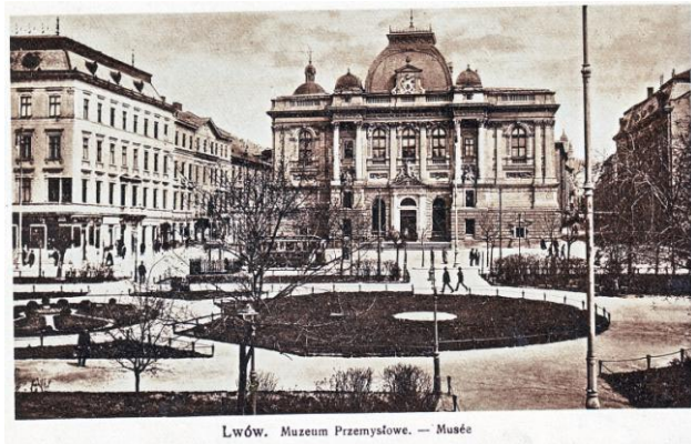
Lwów. Muzeum Przemysłowe. — Muzeum