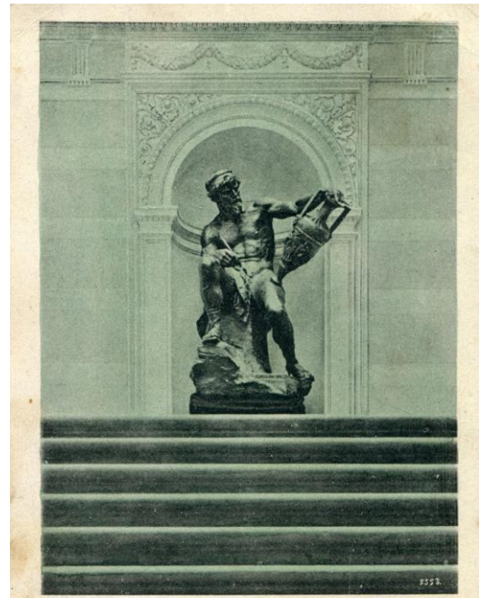
Główna klatka schodowa Muzeum przemysłowego we Lwowie. Rzeźba artyst. rzeźb. Grzegorza Kuźniewicza.