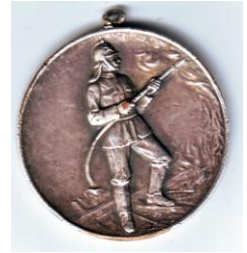
Додаток № 1