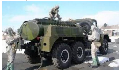
Рис. 2. Авторозливальна станція АРС-14

Основним призначенням авторозливальних станцій є повна дезактивація, дегазація та дезінфекція бойової техніки, транспорту; дегазація та дезінфекція місцевості (території) спеціальними рідкими розчинами; транспортування і тимчасове зберігання дезактиваційних речовин та їх складових компонентів; закачування рідин у дрібні оболонки (ємності); перекачування рідин із однієї тари в іншу (АРС-12У (АРС-14) (рис. 2), АРС-15, АРС-14К, АРС-15М); встановлення аерозольної завіси (АРС-14КМ).