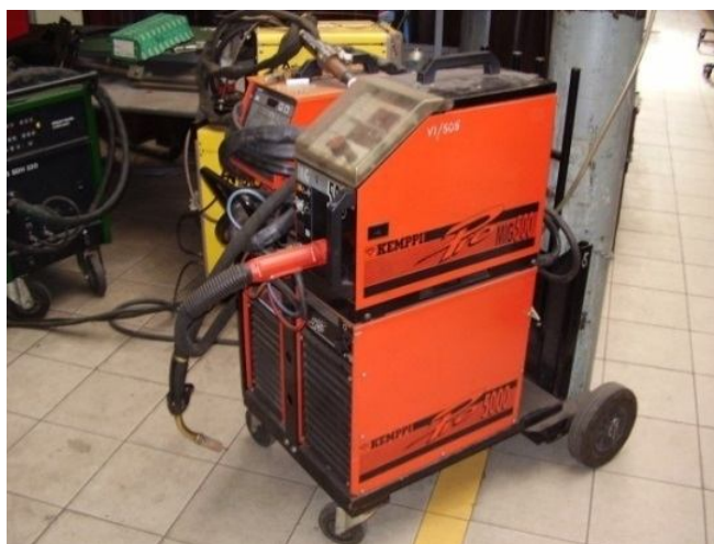
Рисунок 2 – Установа Pro Evolution Kemppi

Властивості наплавлених покриттів залежать не тільки від складу наплавленого металу, але також і від технології наплавлення, яка може значно змінити структуру матеріалу наплавлення, що в свою чергу впливає на його продуктивність. Для отримання покриттів було використано метод дугового наплавлення в газовій атмосфері аргону GMA (MAG). Наплавлення проводились на установці Pro Evolution Kemppi, яка представлена на рис. 2.