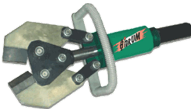
Рисунок 1 – Загальний вигляд ножиць Н-32

Виклад основного матеріалу. Прикладом аварійно-рятувального обладнання, яке застосовується рятувальниками під час надзвичайних ситуацій, є гідравлічні ножиці. Гідравлічні ножиці вітчизняного виробництва, які перебувають на озброєнні пожежно-рятувальних підрозділів України – це «Гідрум» Н-32. Загальний вигляд ножиць з гідравлічним приводом Н-32 представлений на рис. 1.