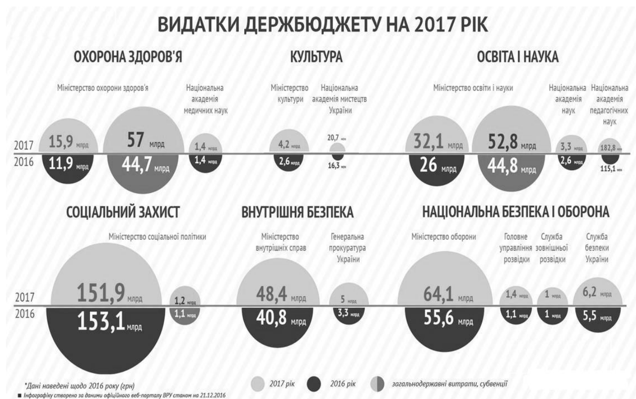
Рис. 2. Видатки держбюджету на освіту [3]

Аналіз становлення проектного середовища освітніх програм суспільства знань у розвинутих країнах світу дає змогу виділити такі основні завдання держави для забезпечення пришвидшення цього процесу в Україні: організація процесу виробництва і розповсюдження знань шляхом підвищення ефективності функціонування освітньо-наукової системи; формування системи сприяння розвитку інноваційної діяльності; стимулювання інтеграції наукових та освітніх структур; фінансова та організаційна підтримка реалізації освітніх проектів, забезпечення інформаційної безпеки і захисту інформації освітніх проектів та програм.