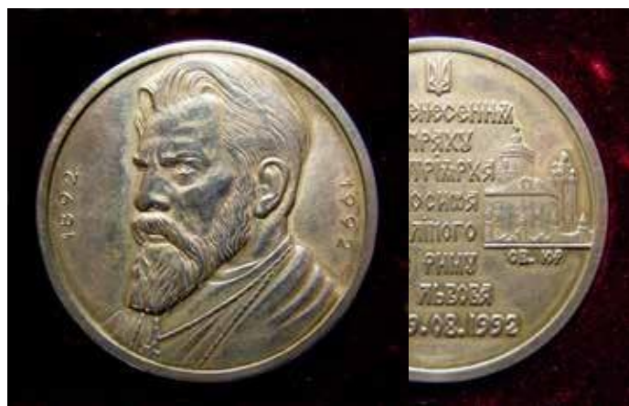
Перенесення праху патріарха Йосипа Сліпого з Риму до Львова