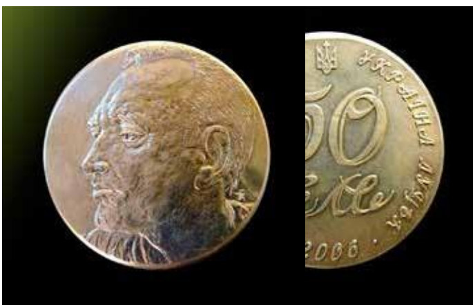
Євген Мельник. 50 років від дня народження