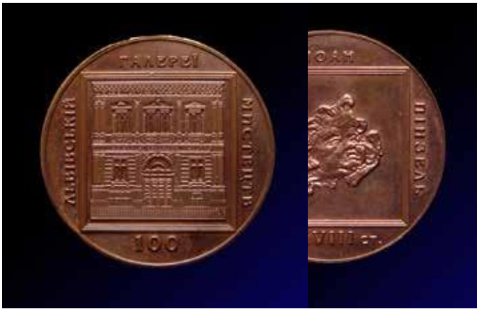
100 років Львівській галереї мистецтв