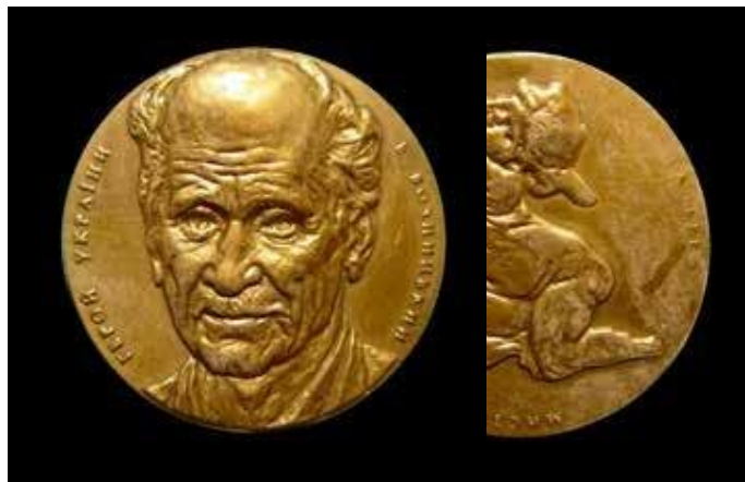
Герой України Б. Возницький