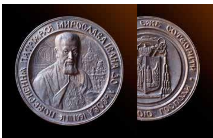
Повернення патріарха Мирослава Івана до Львова