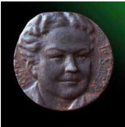
Письменниця Ірина Вільде