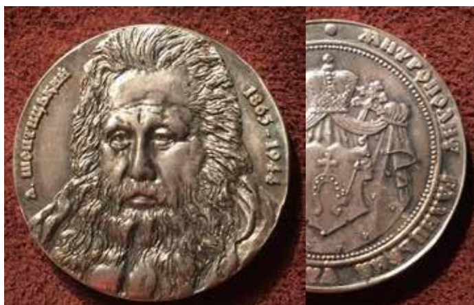
Митрополит Андрей Шептицький