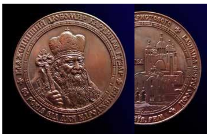
80 років від дні народження кардинала Любомира Гузара