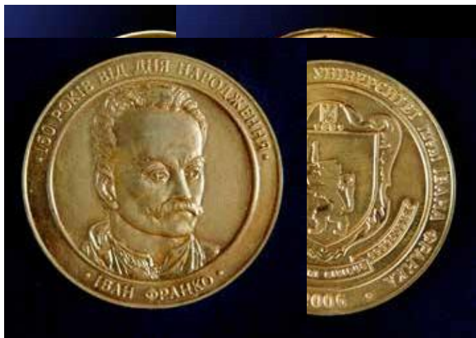
Іван Франко. 150 років від дня народження