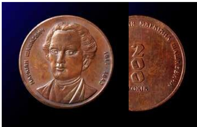
Маркіян Шашкевич. 200 років від дня народження