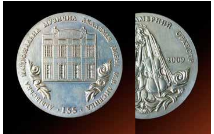
155 років Львівській національній музичній академії імені М. В. Лисенка